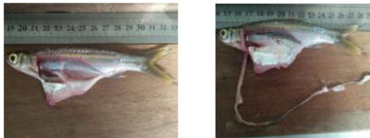
Gambar 2. Lambung dan usus Ikan Seluang

sedangkan lokasi 3 terdapat aktivitas dan pemukiman penduduk dengan kecepatan arus yang sedang. Menurut Husna dan Naszirudin (2009) ikan seluang dapat hidup pada tipe habitat mengalir seperti badan utama dan anak-anak sungai. Rentang kecepatan arus yang cukup luas pada bagian hulu, tengah dan hilir sungai masing-masing pada kisaran 4,4 – 16,7 m/detik, 0,2 – 1,1 m/detik, dan 0 – 1,0 m/detik. Namun demikian, kecepatan arus yang disenangi adalah pada kisaran 0,2 – 1,1 m/detik.