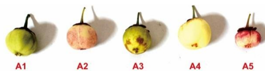
Gambar 3 Penampilan buah katuk A1 aksesii Pandeglang, A2 aksesii Cianjur, A3 aksesii Sukabumi, A4 aksesii Leuwiliang, A5 aksesii Kemang

Karakter aksesii buah katuk dapat dibedakan dari ukuran dan warna (Gambar 3). Aksesii Leuwiliang memiliki ukuran buah yang lebih besar dan memiliki warna kuning cerah dibandingkan aksesii lainnya. Pada aksesii Pandeglang dan Sukabumi memiliki warna buah hijau kekuningan, sedangkan buah aksesii Cianjur dan Kemang menunjukkan warna lebih ke merah-merahan.