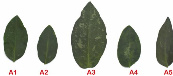
Gambar 1 Penampilan anak daun katuk A1 aksesii Pandeglang, A2 aksesii Cianjur, A3 aksesii Sukabumi, A4 aksesii Leuwiliang, A5 aksesii Kemang

Tanaman katuk aksesii Sukabumi memiliki anak daun terluas dibandingkan dengan aksesii lainnya. Bercak putih pada permukaan anak daun aksesii Pandeglang, Sukabumi, dan Kemang terletak pada bagian yang tidak beraturan (menyebar), sedangkan pada anak daun aksesii Cianjur dan Leuwiliang bercak putih terletak pada bagian tengah permukaan.