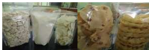
(a) (b) Gambar 5 (a) Produk olahan mocaf dan (b) Mocaf yang belum dan sudah menjadi tepung.

bimbingan dan instruktur dosen Fakultas Pangan halal. Peserta tampak berminat mengikuti pelatihan ini, karena disamping mendapat pengetahuan dan ketrampilan baru juga mempunyai peluang untuk mengembangkan produk yang dihasilkan. Tabel 2 meringkaskan kegiatan penyuluhan dan pelatihan kegiatan IbM. Adapun Tabel 3 mengenai pembuatan pupuk organik dan pembuatan tepung mocaf.