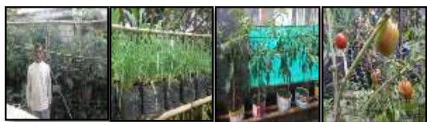
Gambar 6 Hasil kegiatan budidaya tanaman sayuran di pekarangan.

Luaran kegiatan ini diukur melalui adanya peningkatan semangat baru dalam merencanakan hidup menuju ke kehidupan yang lebih baik untuk diri sendiri dan lingkungannya. Indikator lainnya adalah adanya peningkatan pengetahuan dari peserta tentang teknik budidaya tanaman, kemampuan menghasilkan pupuk organik padat dan cair dengan memanfaatkan limbah tanaman, kemampuan menghasilkan tepung mocaf sebagai bahan dasar utama pengganti terigu pada pengolahan makanan dan mengolahnya menjadi produk makanan ringan. Sebelum kegiatan ini, sebagian besar peserta belum memanfaatkan lahan pekarangan, pengolahan singkong masih secara tradisional dan pupuk yang digunakan berupa pupuk kandang dan pupuk sintetis. Hasil penyuluhan dan praktik keterampilan membuktikan bahwa semakin banyak pengalaman dan waktu yang dicurahkan untuk mengikuti pelatihan ini, semakin banyak para ibu rumah tangga dan para petani memperoleh pengetahuan dan keterampilan. Hasil pelatihan budidaya sayuran di pekarangan ditampilkan pada Gambar 6.