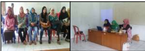
Gambar 2 Kegiatan penyuluhan 'Manajemen Usaha dan Analisis Pendapatan'

Aplikasi dari teknik produksi bersih, antara lain melalui pembuatan pupuk organik padat dan cair (Gambar 3). Pupuk organik ini dibuat dengan memanfaatkan bahan yang terdapat di Desa Bojongmurni. Bahan pembuatan pupuk organik padat (kompos) adalah jerami, dedak, limbah, media jamur, batang pisang, kapur dan EM4. Semua bahan dicacah dan secara bertahap dimasukkan ke dalam wadah kotak bambu, diawali dengan jerami, kemudian diikuti oleh limbah media jamur, batang pisang, dedak dan kapur. Tumpukan bahan organik tersebut disiram dengan menggunakan EM4 yang dicampur gula dan air kelapa, dibiarkan selama 2 minggu, dan diaduk setiap minggu. Pupuk organik padat yang sudah menjadi