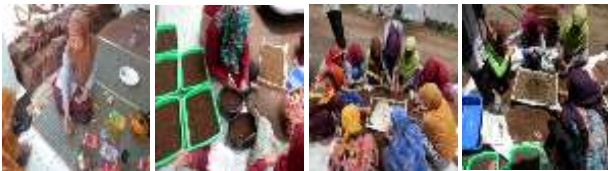
Gambar 1 Kegiatan pelatihan teknik budidaya di lahan pekarangan

mendengarkannya. Umumnya para peserta belum banyak memahami cara mengelola usaha dan menambah pendapatan, sehingga penghasilan yang diperoleh hanya cukup untuk memenuhi kebutuhan dasar. Dengan mengikuti pelatihan ini para peserta dapat mengetahui cara mengelola usahatani dan membuat pembukuan usahatani sederhana. Dengan demikian peserta pelatihan dapat menganalisis usahatani, sehingga dapat diketahui perolehan dari komoditas yang diusahakannya. Di tengah kondisi harga bahan kebutuhan pokok naik, menanam sayuran di pekarangan dapat turut membantu perekonomian dalam rumah tangga, kalau hasilnya lebih, bisa dijual ke pasar.