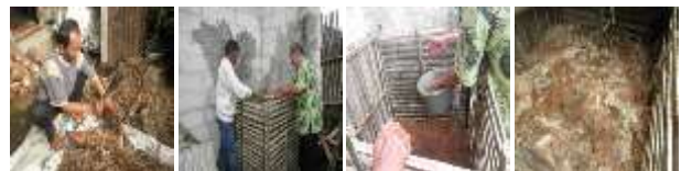
Gambar 3 Pelatihan pembuatan pupuk organik padat dan cair

Bahan pembuatan pupuk organik cair adalah daun kirinyuh ( Chromolaena odorata ) atau kipahit ( Tithonia diversifolia ), sabut kelapa, batang pisang dan EM4, yang dilarutkan dalam air kelapa. Bahan-bahan tersebut diinkubasi selama 2 minggu. Hasil inkubasi berupa beupuk cair dengan kandungan unsur hara makro K, unsur hara mikro dan bahan organik yang telah terdekomposisi. Selain itu terdapat limbah mikroba dari EM4 yang berperan sebagai pemfiksasi N, pelarut fosfat dan dekomposer. Dengan mengetahui materi ini diharapkan peserta dapat memanfaatkan limbah tanaman di sekitar rumahnya untuk bahan media tanam dan pupuk alami. Peserta pelatihan tampak tertarik pada materi ini dan berniat menerapkannya.