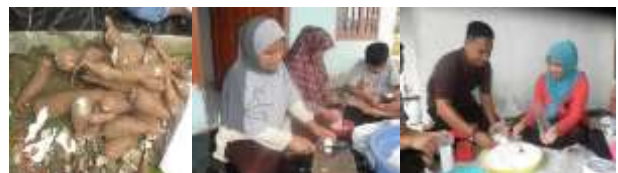
Gambar 4 Pelatihan pengolahan singkong menjadi mocaf

Dalam penyuluhan pembuatan tepung mocaf yang berbahan dasar singkong, pelatih menyampaikan cara pemilihan singkong yang baik, pengupasan, pemotongan, fermentasi dengan penambahan ragi instan (Fermipan) selama 24 jam. Potongan singkong hasil fermentasi dijemur sampai kering dan digiling menjadi tepung mocaf (Gambar 4.)