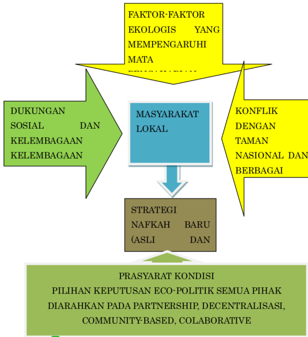
Gambar 3. Model adaptasi ekologis dan strategi nafkah baru yang berpihak kepada kesejahteraan manusia dan kelestarian alam

Namun demikian kondisi tersebut belum cukup untuk dapat mencapai kesejahteraan masyarakat maupun kelestarian alam/ hutan. Diperlukan berbagai prasyarat kondisi yang harus dicapai untuk mendukung