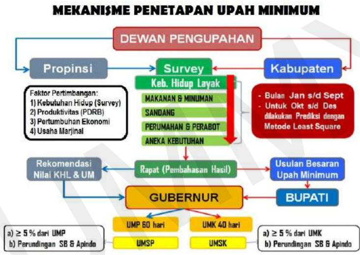
Diagram 1 5 Mekanisme Penetapan Upah Minimum

UMP adalah upah minimum yang berlaku untuk seluruh kabupaten atau kota di suatu provinsi. UMP merupakan suatu standar minimum yang digunakan oleh para pengusaha atau pelaku industri dalam memberikan upah kepada pekerja di lingkungan usaha atau kerjanya. Disebut UMP karena pemenuhan kebutuhan yang layak di setiap provinsi berbeda-beda.