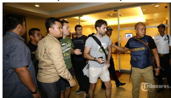
Gambar 2. Tempat Kawasan Bopuncur

Dengan sikap penghindaran terhadap konflik, maka pengaruh negatif semakin meningkat setiap waktu dan tempat di kawasan BOPUNCUR, dan wisatawan semakin menikmati tradisi-tradisi negatif baik di daerah wisata maupun yang dibawa dari negara asalnya. Banyak wisatawan yang berperilaku menyimpang, khususnya yang tidak membawa keluarga. Sebagian masyarakat melakukan pembiaran. Peran pemuka agama dan pemimpin informal diperlukan dengan terus menerus melakukan penyuluhan, bimbingan agama, kepada masyarakat lokal untuk tidak terjerumus dari praktik penyimpangan akibat asimilasi budaya. Rasa ta'zhim masyarakat kepada habaib, berpengaruh terhadap perilaku masyarakat dalam menghadapi wisatawan timur tengah.