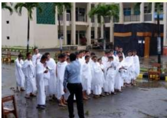
Kegiatan Manasik Haji