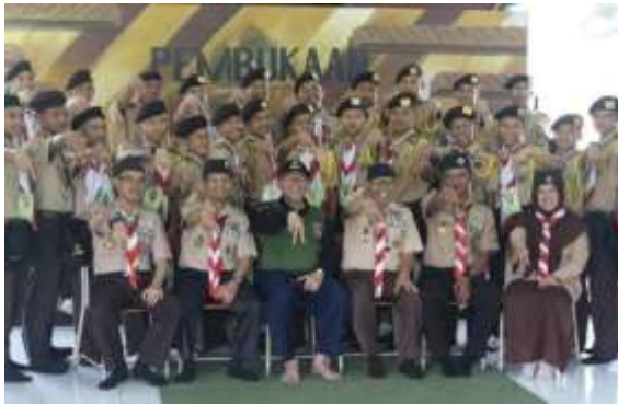
Kegiatan KMD Kalas 5 KMI