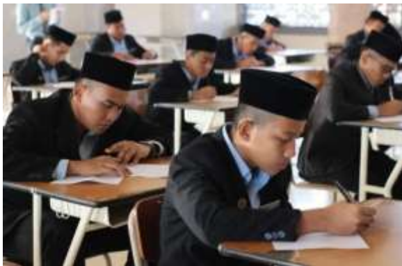
Kegiatan Ujian Siswa Akhir KMI