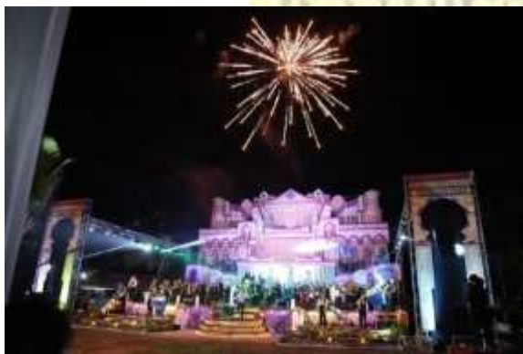
Kegiatan Panggung Gembira