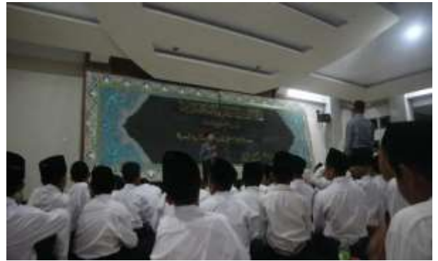
Kegiatan Latihan Pidato 3 Bahasa (Muhadoroh)