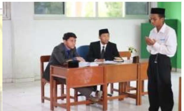
Kegiatan Ujian Syafahii (Lisan)