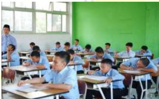
Kegiatan Ujian Tahriri (Tulis)