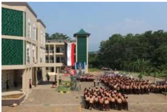
Kegiatan Latihan Pramuka