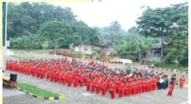
Kegiatan Latihan Pencak Silat