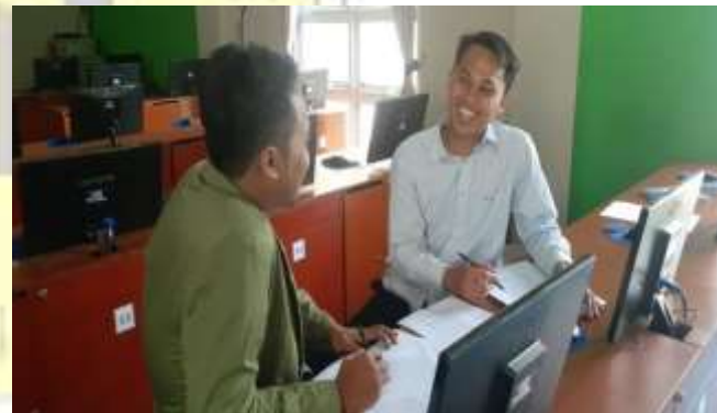
Wawancara Pengasuhan Santri