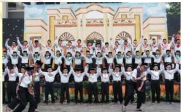
Kegiatan Folk Song