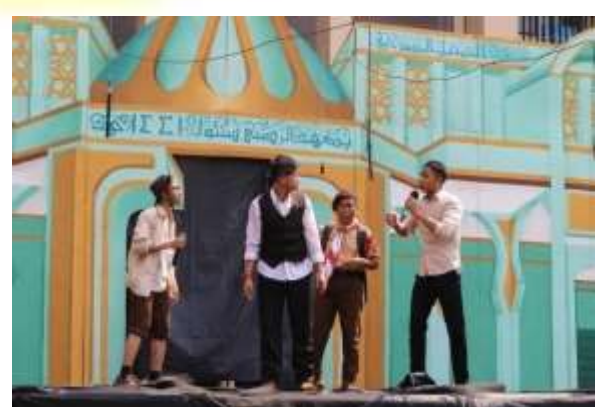
Kegiatan Drama Contes