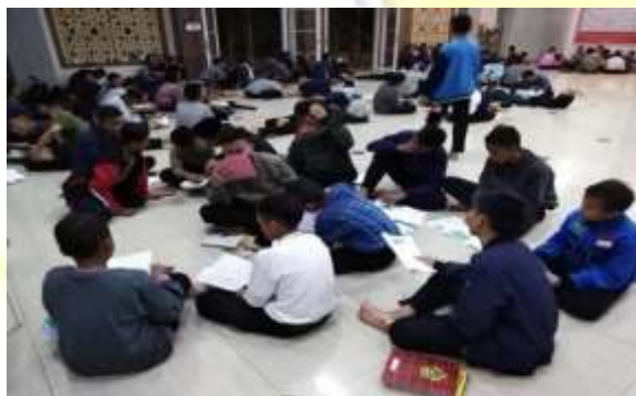
Kegiatan Belajar Malam (Muwajjah)