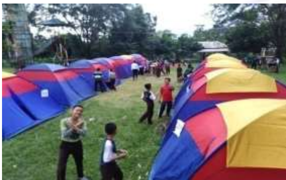
Kegiatan Peekemahan Jum'at, Sabtu, & Ahad