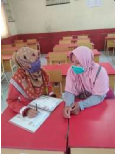
(Wawancara Orang Tua Siswa)