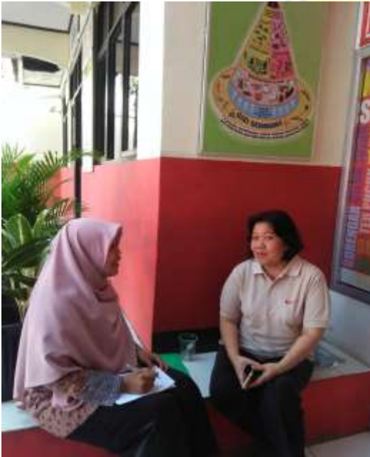
(wawancara Guru Kelas VI)