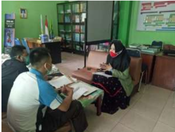
Foto Ketika Wawancara Bersama Guru Kelas IV-A