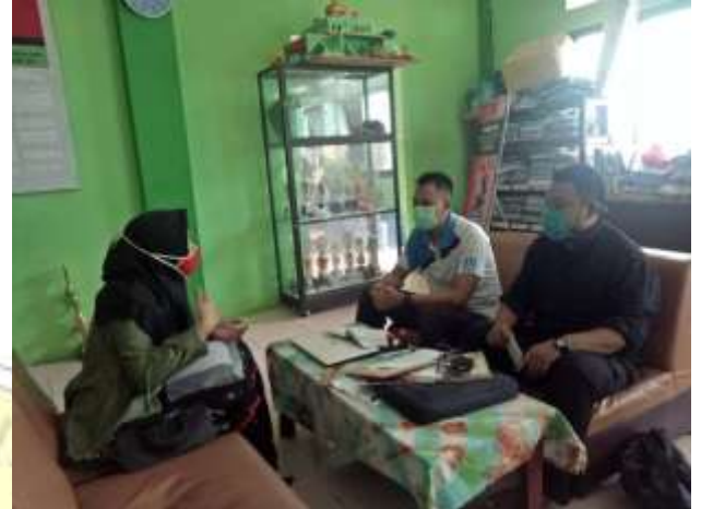
Foto Bersama Kepala Sekolah dan Guru Kelas IV-A