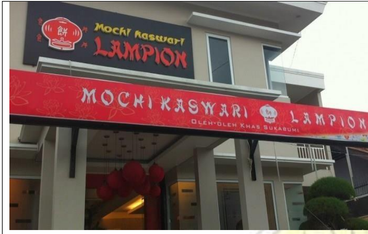
Gambar 1. Lokasi UMKM mochi kaswari