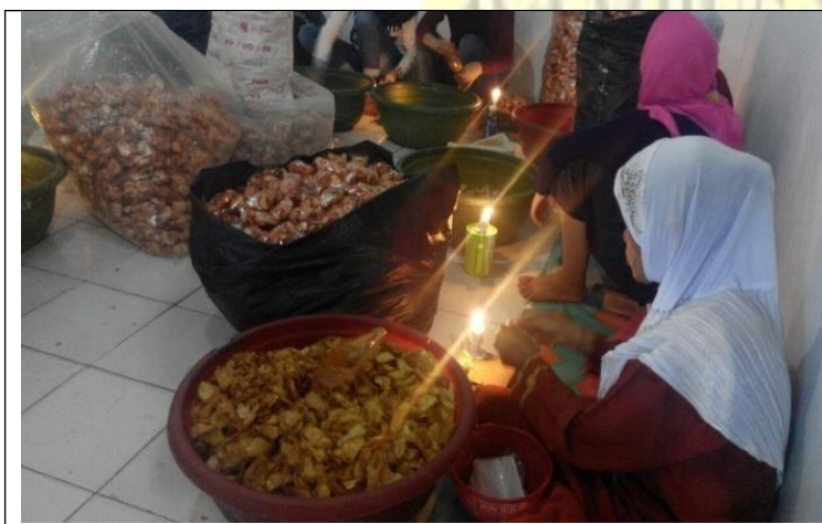
Gambar 5. Perajin UMKM makanan