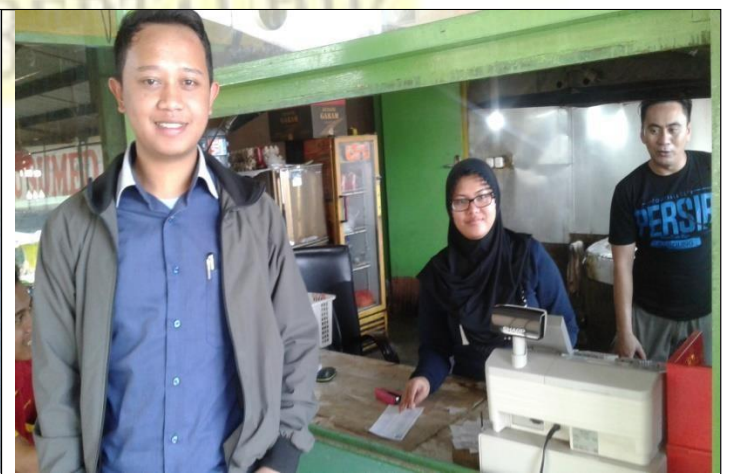
Gambar 6. Proses penyebaran kuesioner