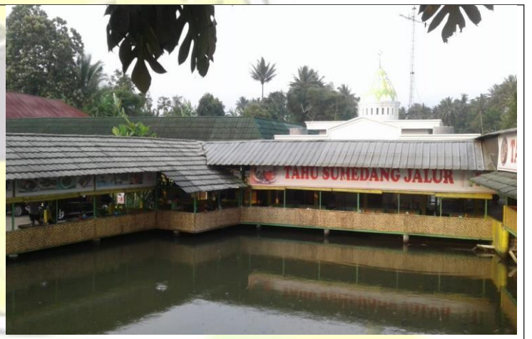
Gambar 4. Lokasi UMKM tahu sumedang