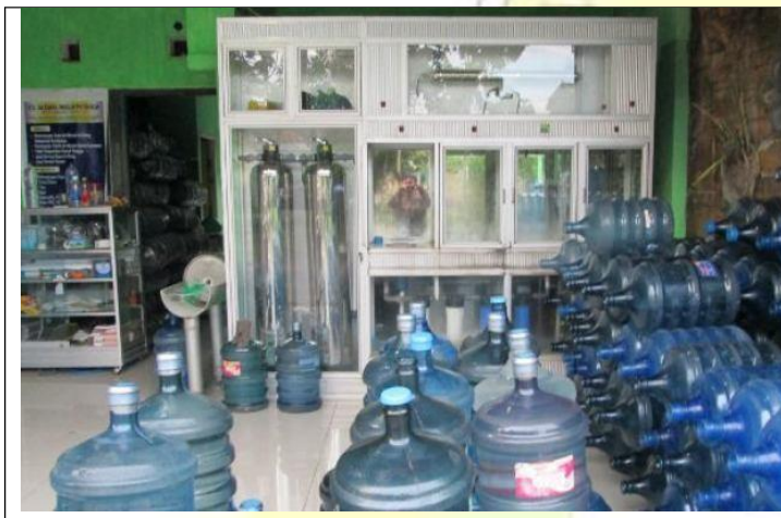
Gambar 3. Lokasi UMKM minuman