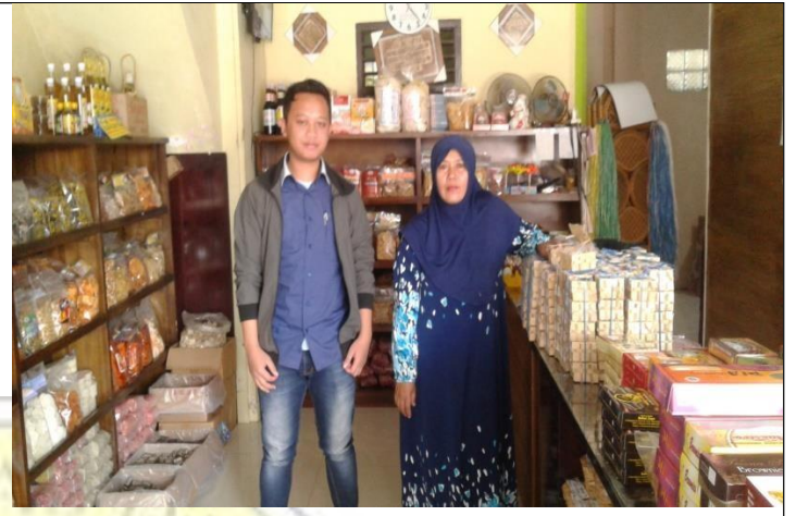
Gambar 2. Lokasi UMKM makanan ringan