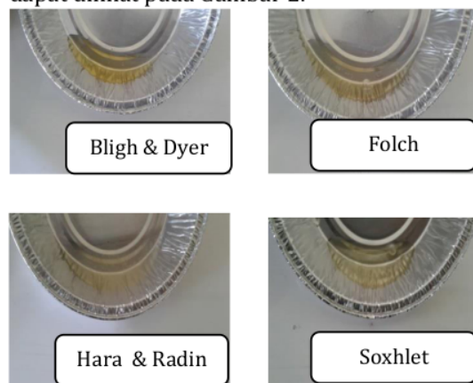
Gambar 2. Hasil ekstrak lemak dengan berbagai metode ekstraksi

Jaringan adiposa atau jaringan lemak secara umum mengandung 76-94% lipid, 1-4% protein, dan 5-20% air (Alm, 2013). Hasil dari ekstraksi lemak ayam dan babi mentah dengan metode ekstraksi Folch, Soxhlet, Hara and Radin, dan Bligh and Dyer dapat dilihat pada Gambar 2.