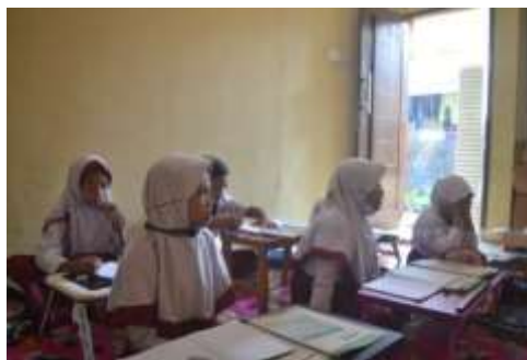
Gambar 4.2 Kegiatan Pembelajaran Luring.

dan lainnya berdekatan dan mampu memenuhi proses dengan benar.