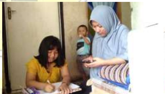
Gambar 1.3 Pendampingan Orangtua dengan Penyediaan Handphone.

Berdasarkan pemaparan yang telah dijelaskan, peneliti dapat menyimpulkan bahwa dalam pembelajaran di masa pandemi ini khususnya pembelajaran daring, handphone dan kuota internet menjadi fasilitas yang sangat penting untuk mengakses internet. Oleh karena itu, peran orang tua adalah memberikan fasilitas handphone yang terhubung ke internet, karena handphone tanpa internet tidak dapat digunakan dalam pembelajaran jarak jauh.