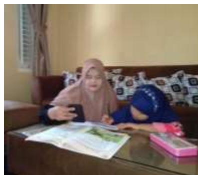
Gambar 4.4 Menciptakan Suasana Nyaman dalam Belajar.

Peneliti menyimpulkan bahwa selain menyediakan fasilitas pada saat pembelajaran berlangsung, orang tua harus mampu menciptakan rumah menjadi tempat belajar yang nyaman, dengan cara membersihkan rumah, menjadikan anak disiplin waktu dalam belajar meskipun belajar di rumah, serta meredam kebisingan yang diakibatkan dari anggota keluarga dan benda – benda yang dapat mengganggu proses pembelajaran. Dengan orang tua yang menciptakan rumah sebagai tempat belajar yang nyaman, maka pembelajaran dapat berlangsung dengan baik.