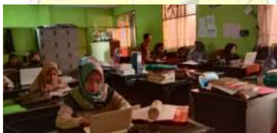
Gambar 4.1 Kegiatan Pembelajaran Daring.

“Bagi sekolah sendiri, jika menggunakan google classroom maka sekolah memiliki fasilitas sekolah diantaranya wifi yang cukup memadai, yang bisa dipakai dalam menggunakan google classroom , dan juga sudah biasa digunakan oleh guru yaitu guru menggunakan handphone dan laptop masing – masing.” (IKS, 12 Juli 2021).