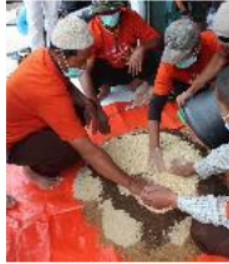
Gambar 1. Pencampuran pakan flushing

Materi tentang perkandangan terkait dengan konstruksi kandang, kandang kambing perah di lokasi mitra menggunakan kandang panggung dengan lantai kayu, dinding setengah terbuka bagian atas sekaligus membantu sirkulasi udara. Jarak antara dasar kandang dan lantai sekitar 50 cm untuk memudahkan saat pembersihan lantai kandang. Atap kandang terbuat dari genteng yang meredam panas karena perubahan suhu yang ekstrim akan berdampak secara fisiologis (Badriyah et al. 2018; Qisthon dan Hartono 2019), jarak antara dasar kandang dan lantai sebaiknya antara 60 - 100, serta tempat pakan sebaiknya dibuat palungan agak tinggi sehingga pakan mudah dijangkau oleh domba.