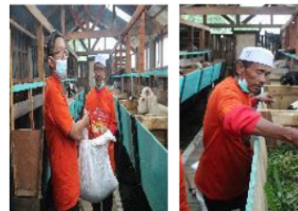
Gambar 2 Pemberian pakan flushing

Proses PkM yang dilakukan di peternakan mitra dilakukan melalui tahapan transfer teknologi (melalui penyampaian materi), penerapan (praktik pembuatan ransum flushing sesuai kondisi ternak) dan target yang dicapai untuk peternak mitra (Gambar 3).