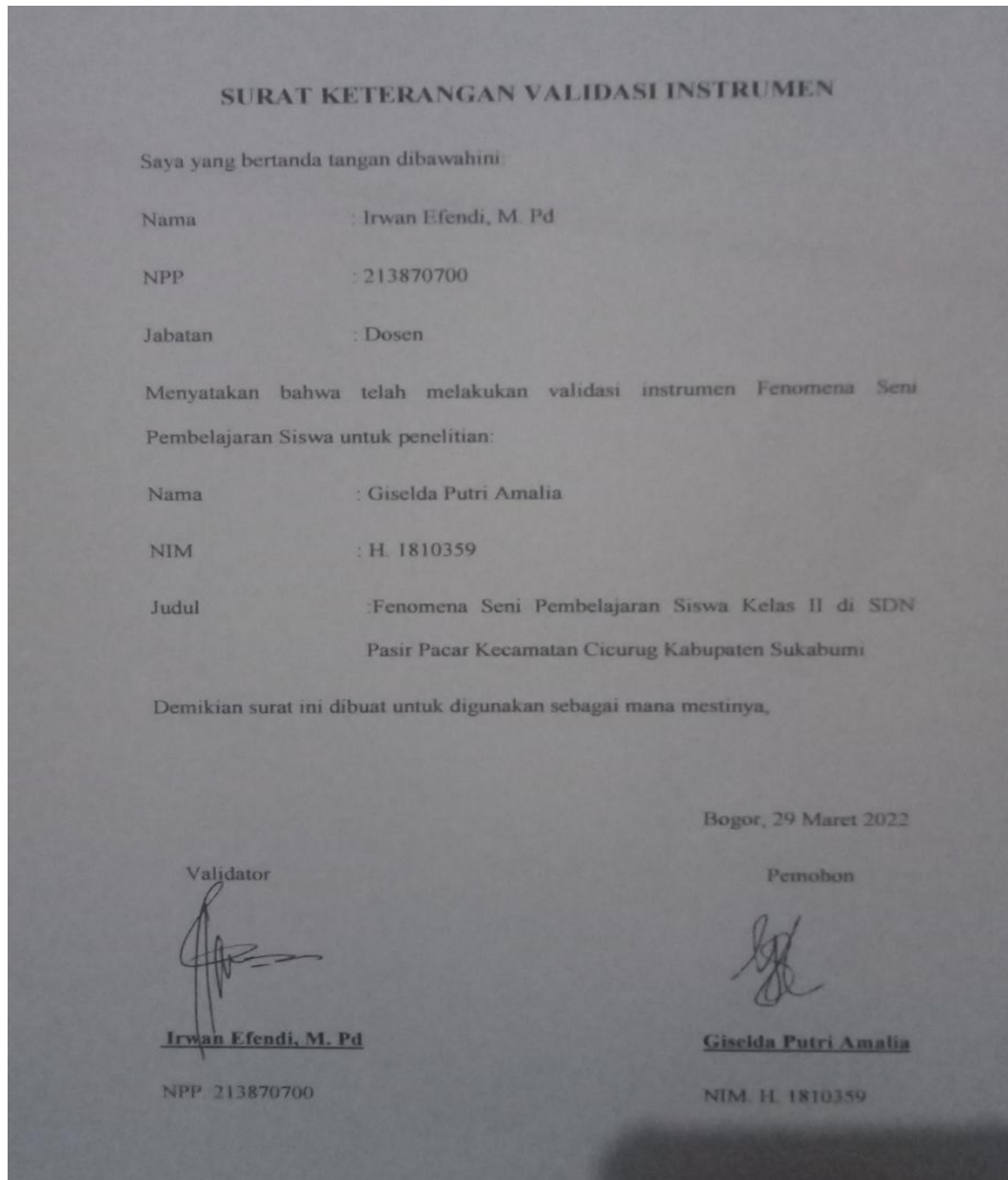
Lampiran 8. 1 SURAT KETERANGAN VALIDASI INSTRUMEN