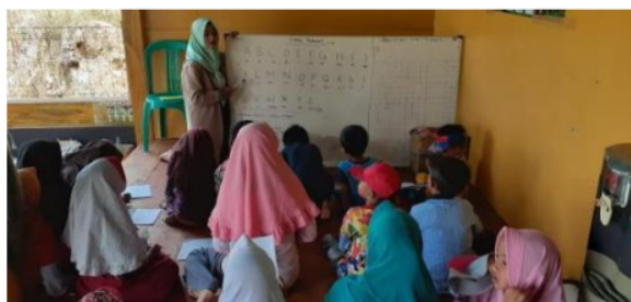
Gambar 5. Kegiatan Bimbel Bahasa Inggris

Awalnya sebelum kegiatan bimbel dilaksanakan, kami melakukan observasi yang kemudian kami sosialisasi terhadap warga dan anak-anak Kp. Legok Nyenang agar dapat mengikuti kegiatan bimbel tersebut. Kegiatan bimbel di waktu pertama dihadiri oleh kurang lebih 50 anak. Anak-anak mulai dari kelas I sampai kelas VI terlihat sangat bergembira mengikuti pembelajaran dimulai dari belajar Bahasa Inggris dan diselingi dengan bernyanyi bersama-sama seperti Gambar 5 berikut.