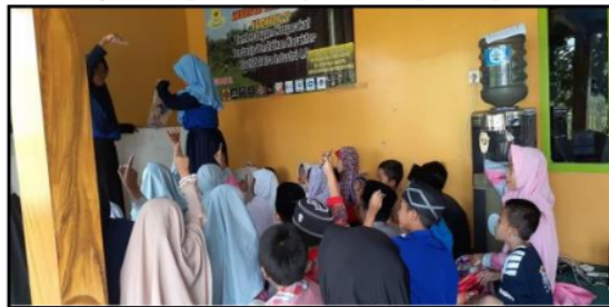
Gambar 4. Kegiatan Bimbil Matematika

Teras impian merupakan kegiatan bimbil (bimbingan belajar) atau kegiatan pembelajaran tambahan yang diberikan kepada anak-anak di Kp. Legok Nyenang, teras impian ini dilakukan di teras posko dimana tempat kami tinggal selama 42 hari. Kegiatan bimbil ini guna untuk meningkatkan prestasi atau hasil belajar yang lebih optimal, membantu memahami dan menyerap pelajaran, memancing anak untuk lebih aktif dan pandai bersosialisasi, dan anak mendapatlan pergaulan positif. Materi yang diberikan berupa calistung, Bahasa Inggris, Bahasa Sunda, Bahasa Arab, Matematika, Tari Daerah dan pengenalan komputer (IT) yang dilaksanakan setiap hari libur dari pukul 10.00 WIB s/d 12.00 WIB. Kegiatan teras impian ini sangat menarik minat anak-anak dapat dilihat dari semangat anak-anak untuk mengikuti kegiatan pembelajaran tambahan, bahkan sebelum jam kegiatan dimulai anak-anak sudah berkumpul untuk mengikuti pembelajaran seperti pada Gambar 4 berikut.