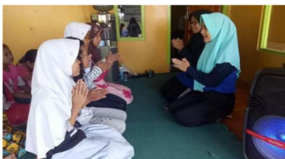
Gambar 6. Kegiatan les tari daerah

Di minggu kedua dan seterusnya Anak mulai terlihat aktif dan kritis dalam bertanya dan menanggapi kegiatan pembelajaran yang mungkin anak-anak sudah mulai bisa menyesuaikan dengan kami. Kami pun mengadakan les tari daerah dikarenakan kurangnya minat anak dan pengetahuan anak mengenai tarian-tarian daerah, dan kebanyakan anak lebih menyukai tarian-tarian modern yang diantaranya mereka tampilkan pada saat acara perpisahan atau kenaikan kelas. Sehingga kami pun termotivasi untuk mengubah mindset anak agar menyukai dan mengenal tari daerah seperti Gambar 6 berikut.