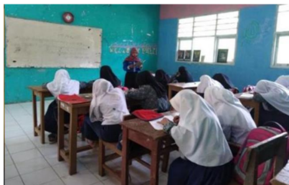
Gambar 8. Kegiatan Mengajar di SD dan MTs Antariksa

Demi merealisasikan peran mahasiswa kampus pendidikan, kegiatan KKN mengajar merupakan kegiatan belajar mengajar, dengan konsep belajar sambil bermain berbasis kelas di SDN 3 Cidahu, SDN Jogjogan, dan MTS Antariksa. Pada kegiatan ini mahasiswa KKN membantu memberikan materi pada peserta didik melalui permainan yang dilakukan di dalam kelas, dengan pengkondisian kelas yang efektif. Di SDN 3 Cidahu kami mengajar kelas II, III, dan VI yang materinya kami sesuaikan dengan kelas masing-masing termasuk di kelas rendah pembelajarannya kami menggunakan kurikulum 2013 atau kurtilas, begitupun di SDN Jogjogan. Adapun di MTS Antariksa kami diberikan kesempatan mengajar kelas VII dengan mata pelajaran Kitab Kuning seperti pada Gambar 8 berikut.