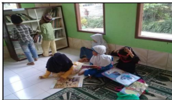
Gambar 3. Kegiatan di Sudut Baca

Adapun hambatan yang ada yaitu tidak adanya tempat yang tersedia untuk pengadaan sudut baca tersebut sehingga kami harus berkoordinasi dengan beberapa pihak yang akhirnya memutuskan untuk membuat sudut baca di Masjid Irsyadul Mutaqqin seperti pada Gambar 3 berikut.