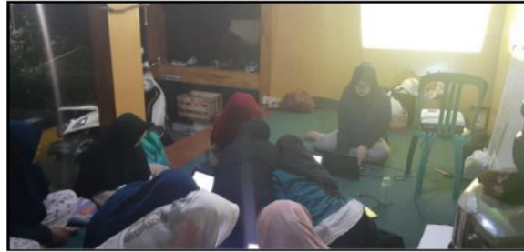
Gambar 7. Kegiatan les computer

Selain itu dalam bimbel pun kami mengajar siswa untuk mengenal bahasa yang diantaranya Bahasa Inggris, yang dimana siswa benar-benar belum pernah diajarkan bahasa Inggris, kami pun mengajarkan anak untuk mengenal nama-nama buah-buahan, sayuram, hewan dan cara mengeja alpabet dengan menggunakan bahasa Inggris, sehingga anak-anak pun sangat antusias meskipun dalam pengucapannya terlihat sulit untuk mereka. Begitupun dengan mengajarkan bahasa Arab, bahasa Sunda, Calistung, dan pengenalan IT seperti pada Gambar 7 berikut.