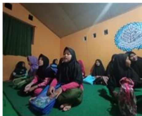
Gambar 4. Kegiatan Pendampingan Keagamaan (menghafal surat-surat pendek)

Pada saat melaksanakan kegiatan pengajian, anak-anak dan remaja juga melakukan kebiasaan untuk melantunkan dan menghafal surat-surat pendek, shalawat, menghafal bacaan shalat dan wudhu serta mempraktekannya secara rutin setiap malam. Hal tersebut dilakukan agar supaya anak-anak dan remaja dapat mengenal, mempraktekan dan dapat mengimplementasikan nilai-nilai keagamaan dalam kehidupan sehari-hari.