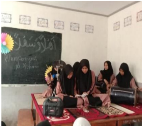
Gambar 5. Kegiatan Pendampingan Keagamaan (bermain marawis di iringi lagu-lagu Islami)

Untuk memberikan bekal tambahan tentang seni, remaja pengajian di majlis taklim juga diberikan pengetahuan tentang bermain marawis yang benar disertai lantunan lagu-lagu Islami