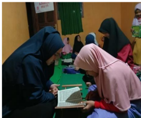
Gambar 2. Kegiatan Pendampingan Membaca Iqra dan Jum'amma

Adapun kegiatan mengaji dilaksanakan setelah selesai shalat magrib sampai dengan pukul 20:00 WIB. Pengajian dimulai dengan membaca do'a, hafalan surat-surat pendek kemudian dilanjutkan dengan membaca iqra, jum'amma dan Al-qur'an.