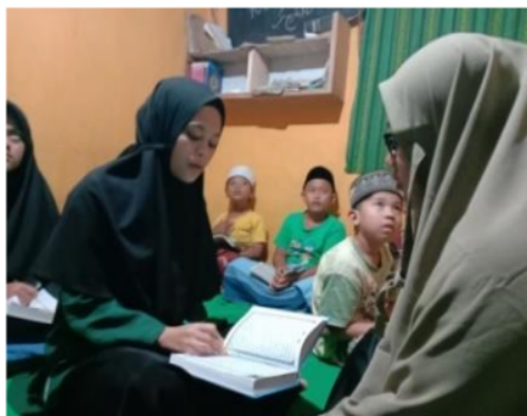
Gambar 3. Kegiatan Pendampingan Membaca Al-qur'an

Kegiatan pendampingan juga dilakukan kepada anak-anak remaja untuk mampu membaca Al-quran dengan menggunakan tajwid dan makhorijul huruf yang baik.