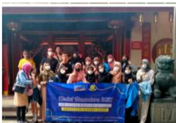
Mengunjungi Vihara Dhanagun