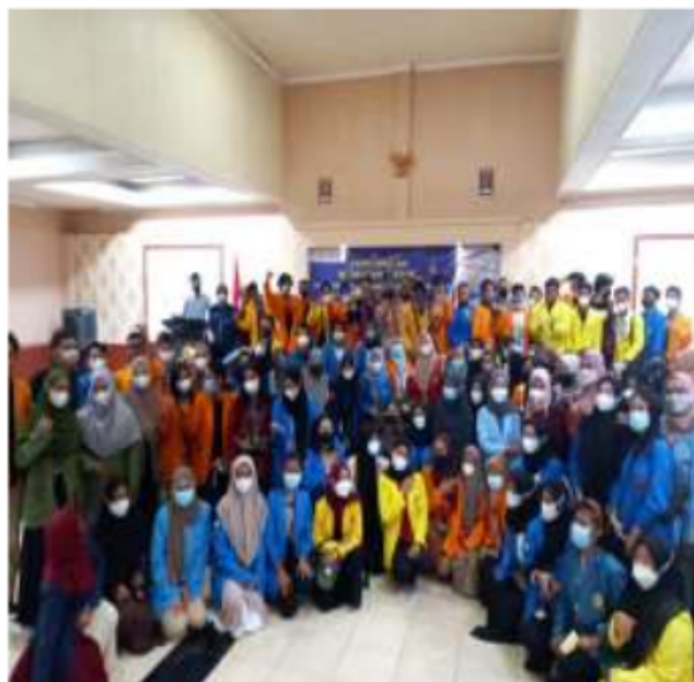
Bersama Teman-teman PMM DN

Sebenarnya banyak yang berkesan dari beberapa tempat yang telah ku kunjungi namun ada yang sangat berkesan bagiku. Vihara Dhanagun adalah tempat yang paling berkesan karena kita bisa saling lebih menghargai perbedaan tempat ibadah setiap umat beragama yang berbeda-beda. Kunjungan ke Vihara Dhanagun membuatku memahami betapa sakralnya tempat ibadah suatu agama dan memberiku pemahaman mengenai toleransi antar umat beragama yang belum pernah kuketahui sebelumnya. Kegiatan Modul Nusantara memberiku pelajaran mengenai menjunjung toleransi terhadap perbedaan yang ada, mengenal budaya Indonesia dan mencintai keberagaman Indonesia yang begitu luar biasa.