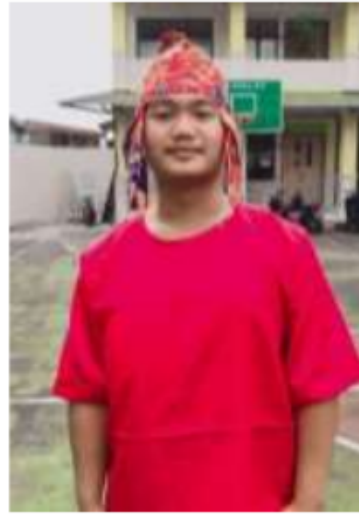
Vaydel Dondan Bara'Tiku

Universitas Bina Bangsa Getsampena – Aceh