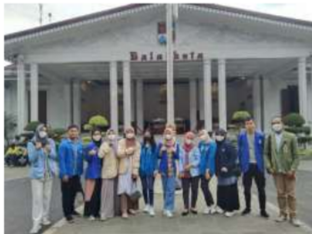
Berfoto Setelah Bertemu dengan Wakil Walikota Bogor

Harapanku sebelum ikut Modul Nusantara ini ialah aku bisa mengenal beragam suku, budaya, adat, agama, pola pikirku yang Alhamdulillah semakin baik, memperbanyak relasi, bertemudengan orang-orang baru. semua itu sudah terpenuhi. Aku menjadi paham bagaimana yang di katakan dengan indahnya bertoleransi. Benar ketika kita sudah mengerti caranya menghargai orang, bagaimana karakternya, apa agamanya, bagaimana suku, budaya, adat-istiadatnya kita semakin sadar bahwa inilah kehidupan. Tak ada namanya perbedaan. Kita tinggal di satu negeri dimana semua penduduknya