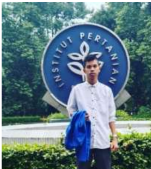
Kunjungan ke Insitut Pertanian Bogor

Selain Tari Saman, Aceh juga di kenal dengan kopinya yakni kopi arabika Gayo. Sesuai dengan namanya, kopi ini 28 berasal dari dataran tinggi Gayo yang tumbuh dan berkembang di daerah Takengon, Aceh Tengah dan Bener Meriah. Hamparan luas perkebunan kopi tumbuh di dataran seluas 95.000 Ha dengan ketinggian kurang lebih 1200 meter. Kopi ini 35 merupakan varietas kopi arabika. Kopi Arabika Gayo telah di kenal dunia karena memiliki cita rasa khas, dengan ciri utama aroma dan rasa yang kompleks dan kekentalan yang kuat. Bahkan pada International Conference on Coffee Science , di Bali, Oktober 2010 kopi dataran Gayo dinominasikan sebagai kopi arabika terbaik di dunia. Harga kopi Gayo bervariasi 148 tergantung jenisnya. Harga satu kilogram kopi Arabika Gayo bubuk sekitar Rp. 140.000,- sampai Rp. 300.000,-.