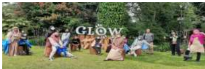
Momen ketika aku mengunjungi Kebun Raya Bogor

Setelah berjalan-jalan mengelilingi Kebun Raya Bogor, kunjungan kami selanjutnya yaitu ke Surya Kencana tepatnya di Vihara Dhanagun yang dikenal juga sebagai Klenteng Hok Tek Bio. Vihara ini terletak di Jalan Suryakencana No. 1. Terlepas dari perbedaan keyakinan dan kami, keinginan kami mengunjungi vihara ini murni karena sejarah yang ada di baliknya. Di sana kami ketemu ibu pengelola vihara tersebut, dan kami di jelaskan secara langsung mengenai sejarah vihara tersebut.