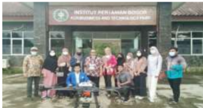
Kunjungan ke Kampus IPB University