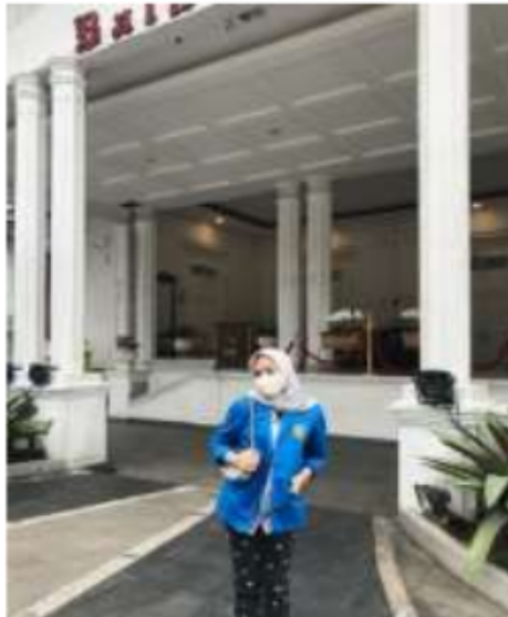
Aku saat Kegiatan Inspirasi dengan Wakil Walikota Bogor

vihara hanya menjadi tempat badah umat Budha, namun ternyata vihara ini boleh dikunjungin oleh siapa saja dan dapat menjadi tempat berdoa orang yang memiliki agama apa saja. Itulah menariknya. Bahwa tidak ada yang namanya perbedaan antara suku, agama, budaya dan lainnya. Pengalaman itu membuat kami bisa belajar saling menghargai antar umat beragama.