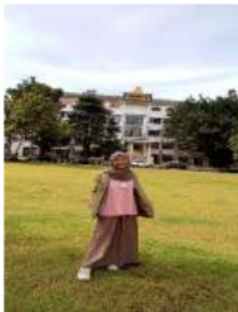
Aku di Depan Kampus Universitas Djuanda

Tionghoa yang tergabung dengan kebudayaan Sunda. Di awal gerbang masuk kami langsung diajak masuk dan melihat setiap sudut dan isi dari Vihara Dhanagun yang merupakan salah satu peninggalan tokoh terkenal dari masyarakat Tionghoa pada saat itu. Hal ini memiliki pelajaran tentang bagaimana suatu kebudayaan dengan kebudayaan lainnya saling terhubung tanpa adanya perpecahan.