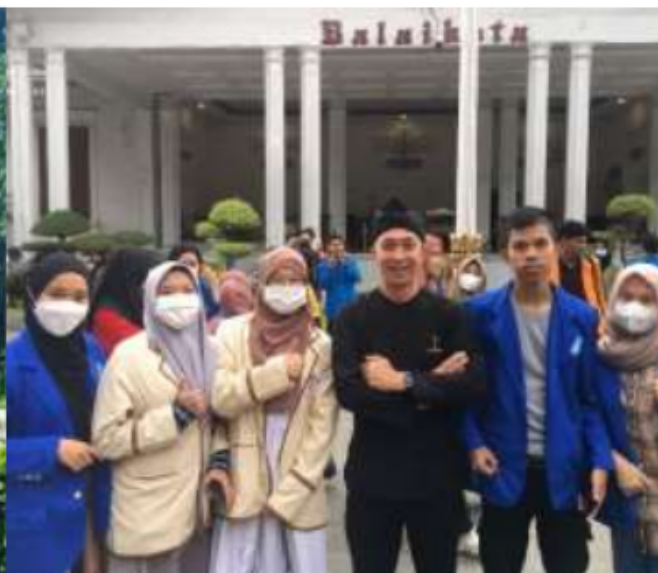
Bersama Wakil Walikota Bogor