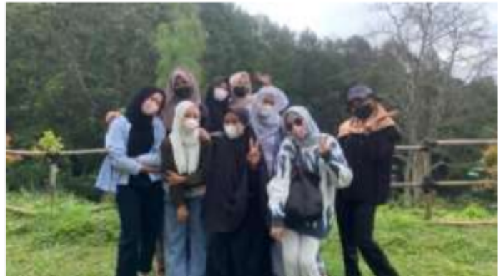
Bersama Teman-teman di Bumi Perkemahan Citeko, Puncak

Mungkin itu saja sedikit ceritaku tentang kegiatan program pertukaran mahasiswa ini. Sangking terlalu asiknya mungkin tidak akan cukup untuk dituangkan ke dalam buku. Sekian dulu ceritaku. Semoga nanti setelah kepulangan kita dapat berjumpa lagi di lain waktu.