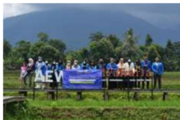
Kegiatan Kami di Desa Wisata Agro Edukasi Wisata Organik (AEWO) Mulyaharja

Seluruh kegiatan Modul Nusantara mempunyai kesan tersendiri bagi ku. Namun, ada dua kegiatan yang paling berkesan bagiku. Yang pertama, kegiatan yang memberikan pe 3 aran moral yang paling berkesan yaitu berkunjung ke Desa Wisata Agro Edukasi Wisata Organik (AEWO) Mulyaharja atau dikenal juga sebagai Kampung Tematik Mulyaharja. Pembangunan Desa Wisata ini memberikan kisah inspiratif dibaliknya. Di sana, pengunjung 3 kan disambut dengan hamparan sawah yang menyejukkan mata. Sawah ini berada di kawasan pertanian organik yang dikelola langsung oleh masyarakat lokal. Sawah seluas 30,4 hektar dikelola