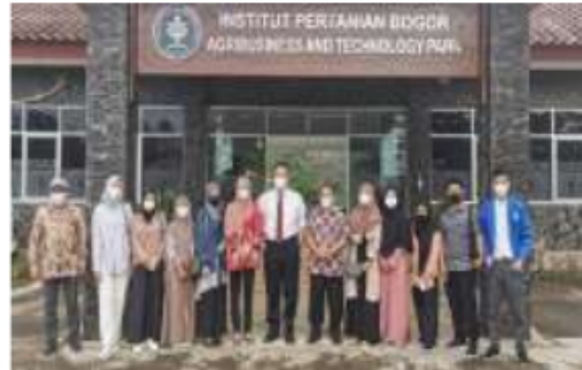
Bertemu dengan Rektor IPB University

Saat pertemuan dengan Wakil Walikota Bogor kami diberi tahu bagaimana pemerintah daerah mengelola kota Bogor baik tempat wisata dan bagaimana pemerintah daerah membangun masyarakat Bogor yang inklusif dan memiliki toleransi yang tinggi serta saling menghormati. Setelah kegiatan selesai, di akhir kami melakukan sesi foto-foto bersama Wakil Walikota Bogor.