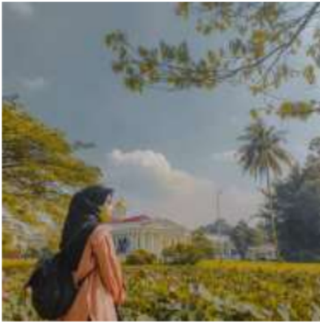
Aku di Kebun Raya Bogor

petani mitra dan market serta restoran yang menggunakan hasil panen mereka.