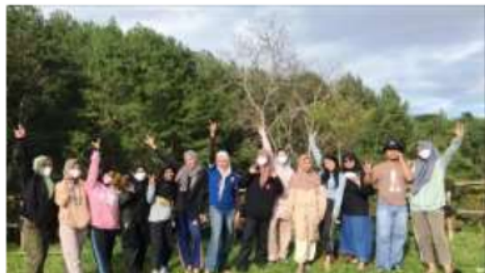
Kami di Bumi Perkemahan Citeko