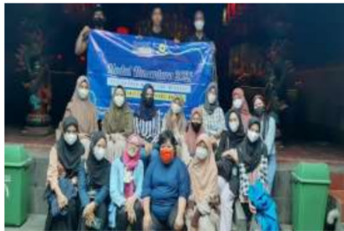
Kami Berfoto Bersama dengan Pengurus Vihara Dhanagun

Sebelum mengikuti kegiatan Modul Nusantara tentunya memiliki banyak harapan, dan harapan itu terpenuhi setelah mengikuti kegiatan Modul Nusantara. Dimulai dari memiliki teman dari berbagai daerah di seluruh Indonesia, saling berbagi dan belajar tentang keberagaman daerah masing-masing, jalan-jalan mengunjungi tempat-tempat yang ikonik, makan-makan bersama, bersenang-senang bahkan kepanasan dan keujanan juga bersama.