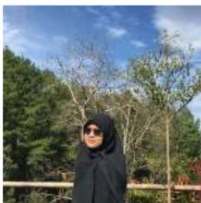
Berfoto di Bumi Perkemahan Citeko

yang lumayan lama. Abah-ku adalah seseorang yang susah untuk melepaskan anaknya jauh dari dirinya. Banyak kekhawatiran yang muncul dibenak Abah-ku terlebih aku adalah seorang perempuan. Entah masalah kesehatan, keuangan, 16 mpat tinggal, dan lain sebagainya ditanyakan padaku sebelum berangkat, mengatasi culture shock karena budaya yang tentu berbeda, belajar mengatur ritme belajar yang baru karena aku harus k 16 h didua kampus yang berbeda, bertemu dengan orang-orang hebat yang membuat aku merasa belum ada apa-apanya, dan yang pasti belajar bagaimana menghargai keanekaragaman karakter, budaya, pandangan, agama, dan kepercayaan. Di sinilah aku bisa memaknai arti Bhineka Tunggal Ika yang sesungguhnya.