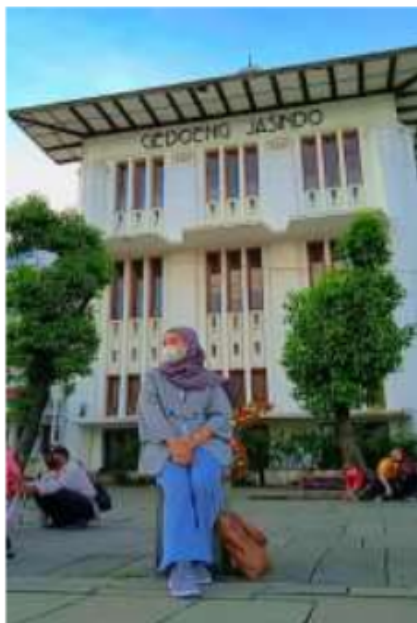
Berfoto di Kota Tua Jakarta