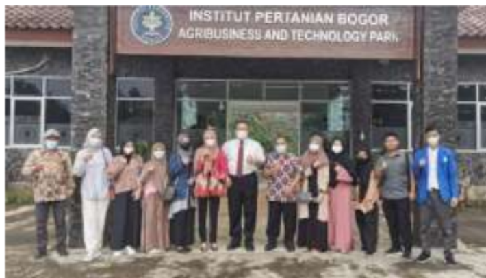
Berfoto dengan Rektor IPB University

Kegiatan Modul Nusantara sebenarnya semuanya berkesan. Mulai dari pergi ke sawah yang di depan rumahku pun ada, sampai ke tempat yang tidak pernah kubayangkan akan kesana yaitu IPB. Wah aku merasa keren lah pokoknya. Terus bisa jumpa dan foto bareng sama Wakil Wali Kota Bogor yang bahkan orang Bogor sendiri pun kadang belum pernah foto sama Wakil Wali Kota Bogor. Di sisi inilah aku merasakan bahwa mengikuti program Modul Nusantara sebenarnya semuanya berkesan karena banyak hal yang menjadi kenangan hebat yang kujalani di kota hujan ini. Tentu saja semua ini sudah direncanakan Allah SWT untukku.