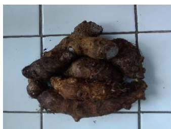
Gambar 1. Talas Belitung

Salah satu tanaman yang mengandung senyawa mirip kolagen adalah talas belitung (Alalor et al. , 2014). Talas Belitung merupakan umbi berpati yang memiliki bentuk silinder hingga agak bulat dan terdapat ruas dengan beberapa bakal tunas (Gambar 1). Selain itu, talas Belitung juga asam hialuronat yang memiliki sifat yang mirip dengan asam hialuronat hewani. Asam Hialuronat nabati terdapat di talas belitung mempunyai kandungan karbohidrat kompleks sifatnya mirip dengan hyaluronan hewani (Alalor et al. , 2014). Hyaluronan nabati merupakan karbohidrat lebih khusus mukopolisakarida yang terjadi secara alami didalam semua oraganisme hidup (Necas et al. , 2008). Struktur dari Asam Hialuronat nabati dan hewani dapat dilihat pada Gambar 2.