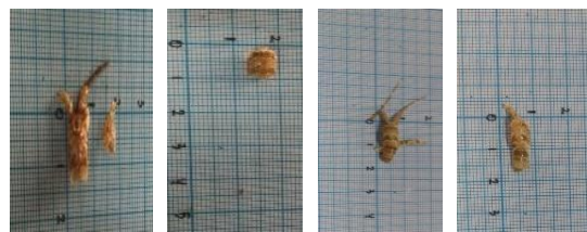
Gambar 3. Contoh kematian lobster pasir akibat kanibalisme

Kualitas air adalah salah satu faktor yang mempengaruhi tingkat frekuensi molting dan kanibalisme. Namun demikian, kualitas air selama pemeliharaan dalam kondisi baik, data kualitas air selama penelitian dapat dilihat pada Tabel 1.