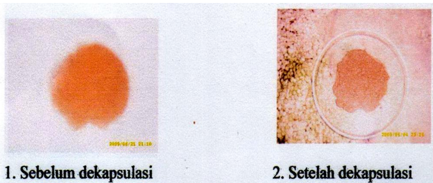
Gambar 1 Siste Artemia sp. yang belum dan sudah didekapsulasi

hemoglobin). Karena hematin itulah, maka siste Artemia sp. jadi berwarna coklat, dengan adanya proses dekapsulasi, senyawa lipoprotein tersebut dapat dilarutkan oleh bahan-bahan oksidator yaitu senyawa hipoklorit, baik berupa kaporit maupun klorin. Seperti yang terlihat pada Gambar 1, kondisi siste setelah didekapsulasi bentuknya lebih kecil, warnanya lebih terang, cangkangnya lebih tipis, cenderung tenggelam, dan cenderung lebih lengket.