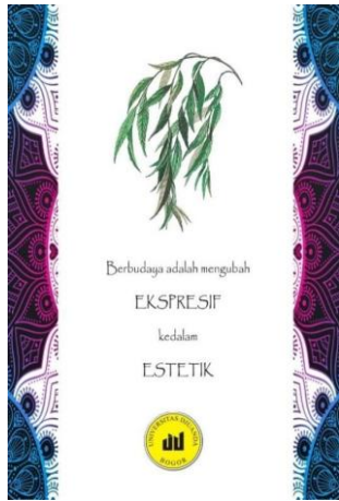
Gambar 4. Sesudah revisi bagian belakang cover