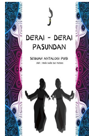
Gambar 2. Sesudah revisi bagian depan cover