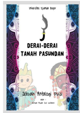
Gambar 1 Sebelum revisi bagian cover depan