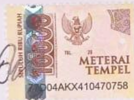
Ade Mulyana C.1811065