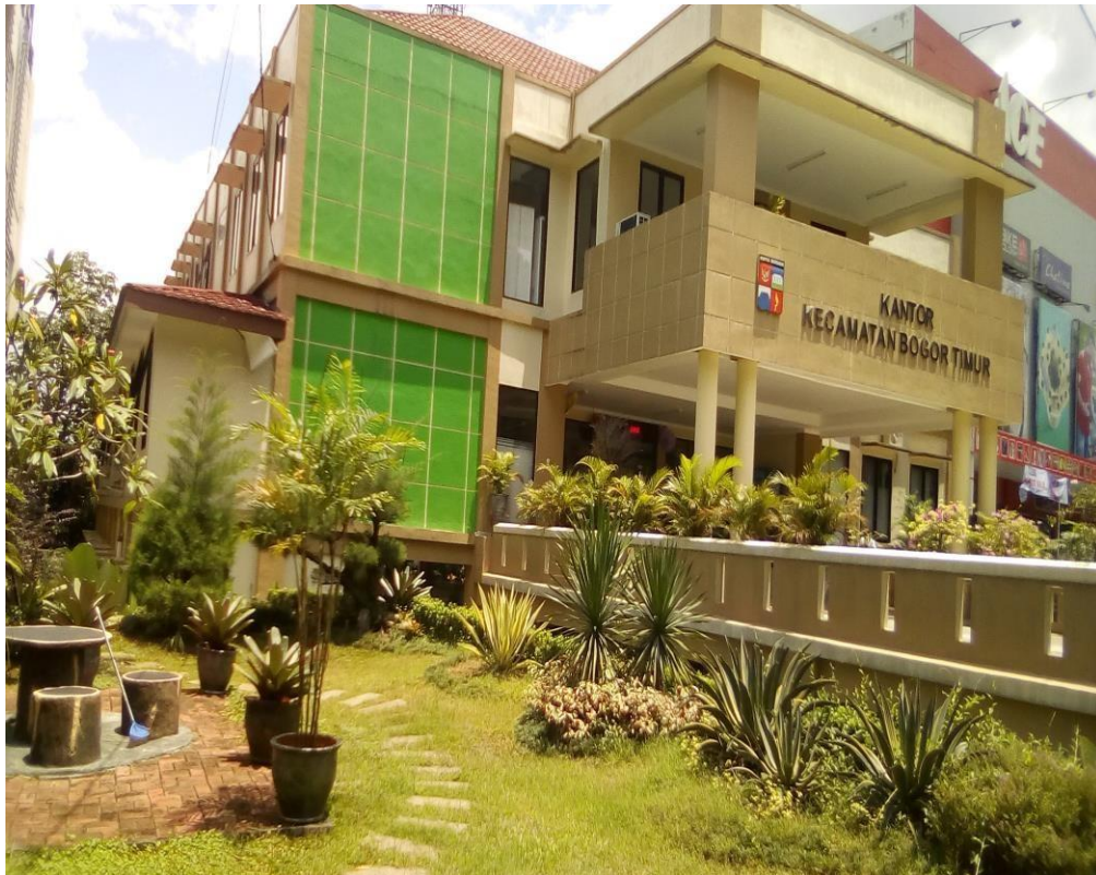
Kantor Kecamatan Bogor Timur Kota Bogor