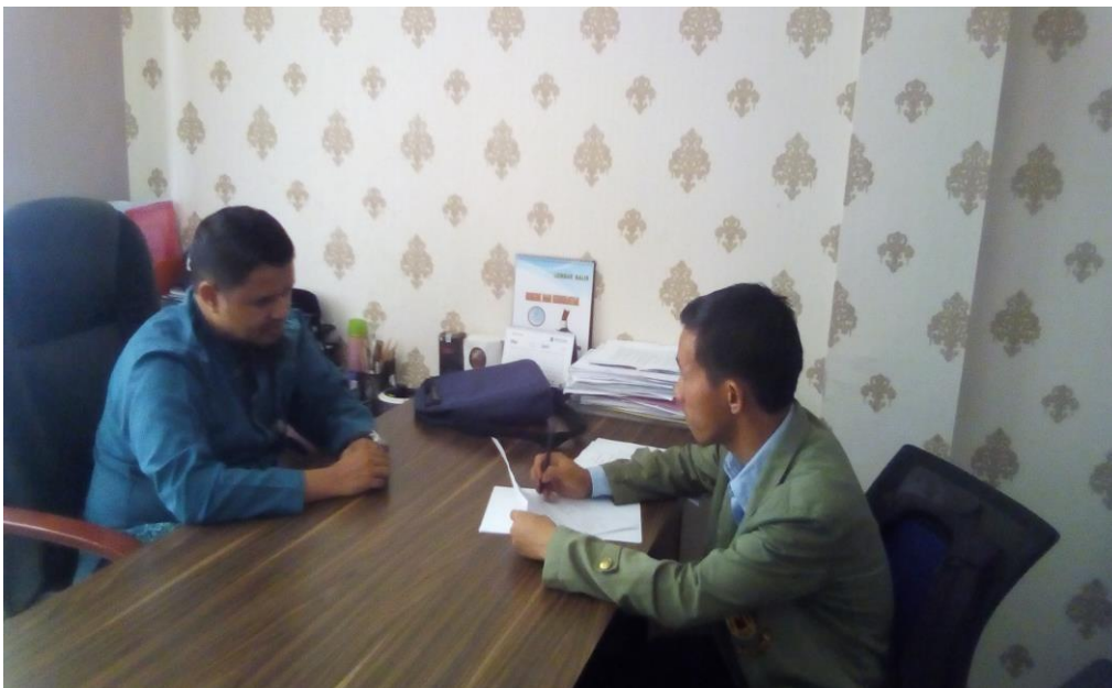
Wawancara Kepada Sekretaris Camat