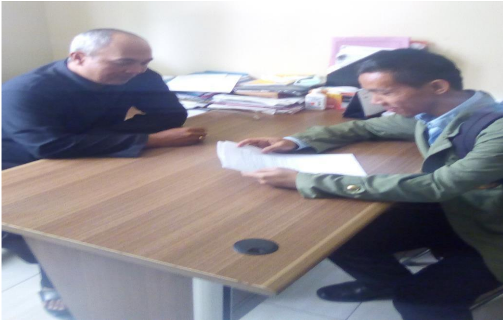
Wawancara Kepada Kepala Bagian Umum dan Kepegawaian