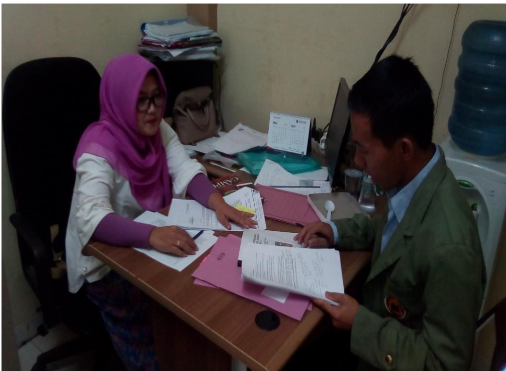
Wawancara Kepada Kepala Bagian Keuangan