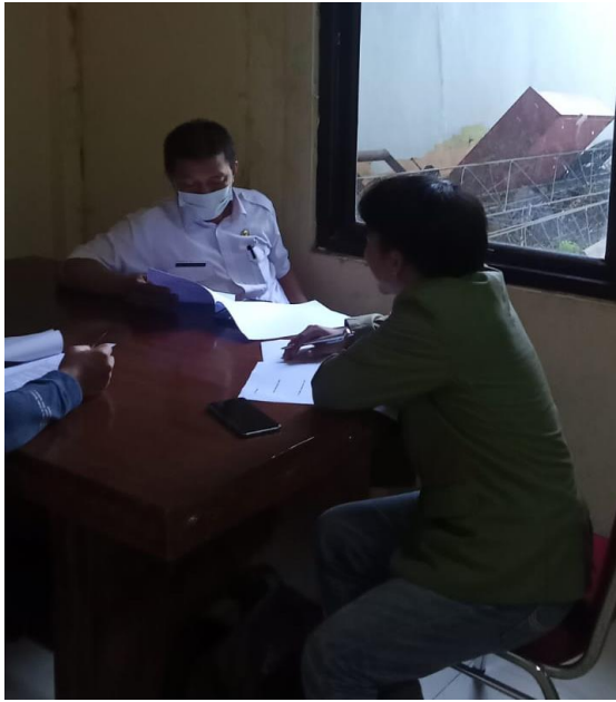
Wawancara terhadap responden