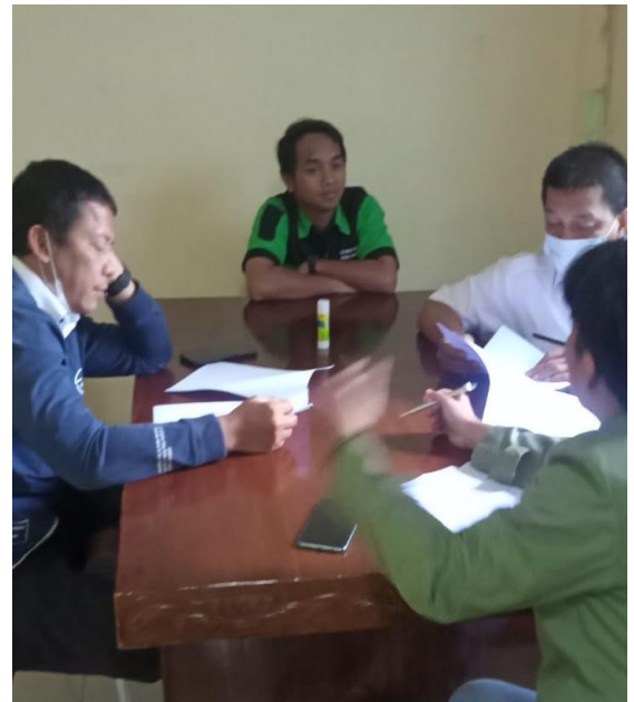
Penyebaran kuesioner terhadap responden