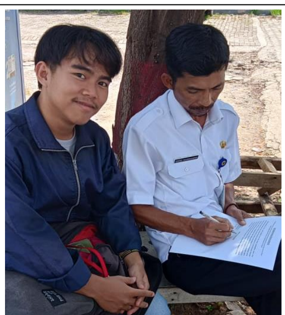
Pengisian kuesioner oleh responden