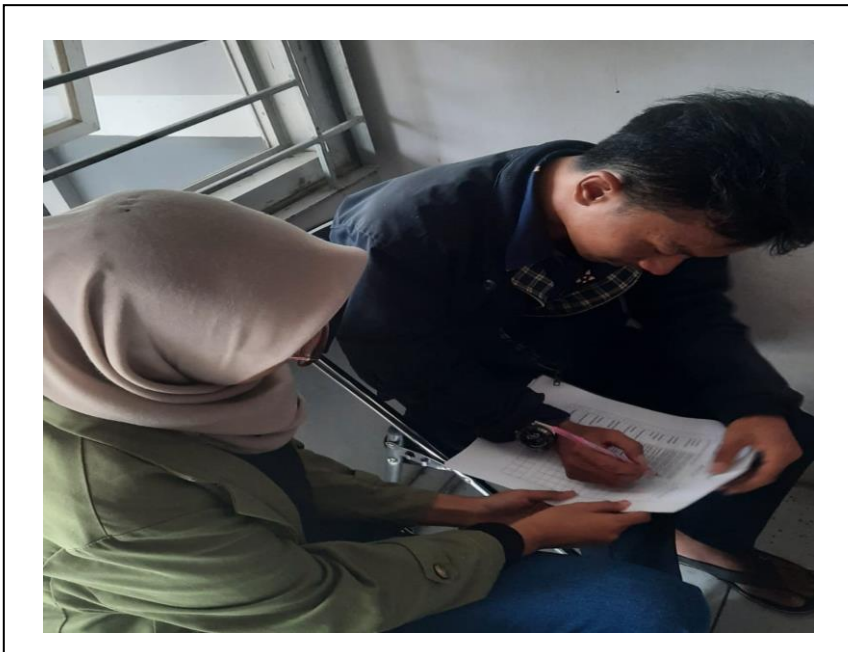
Pengisian kuesioner pengurus sudut baca Kelurahan Bojongkerta