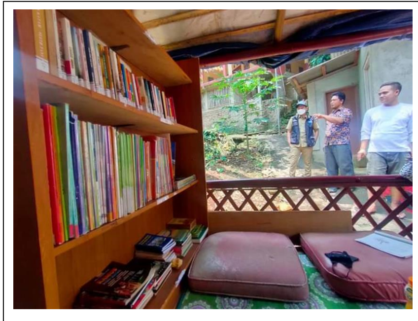
Sudut Baca Kelurahan Cipaku