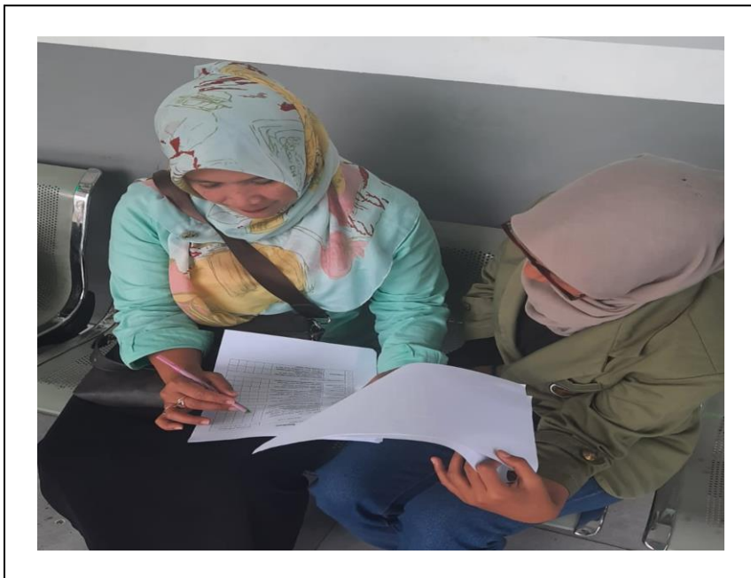
Pengisian Kuisioner Pengurus Sudut Baca di Kelurahan Cipaku