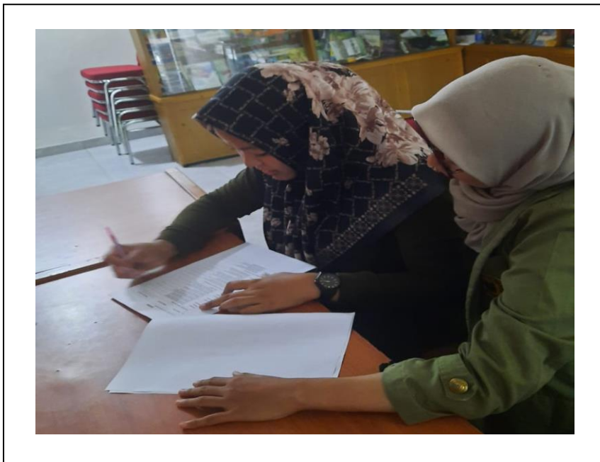
Pengisian Kuisisioner Pengurus Sudut Baca di Kelurahan Bondongan