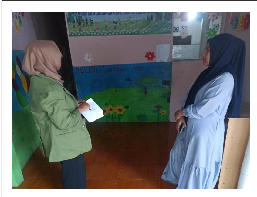
Wawancara dengan Ketua Sudut Baca Kelurahan Bondongan