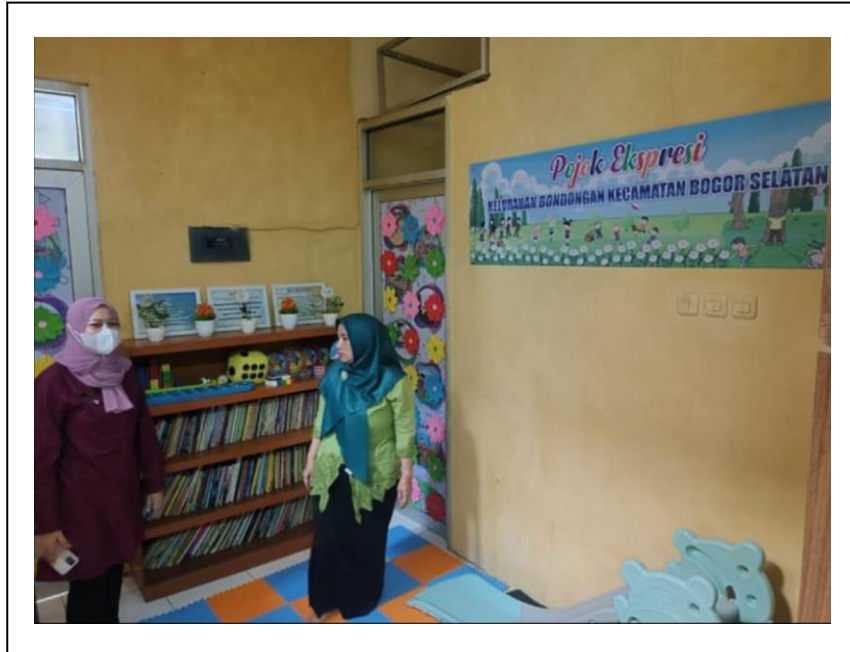
Sudut Baca Kelurahan Bondongan