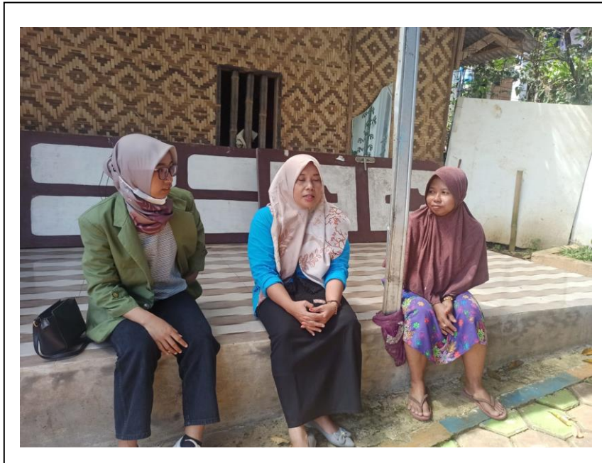
Wawancara dengan pengurus sudut baca Kelurahan Bojongkerta