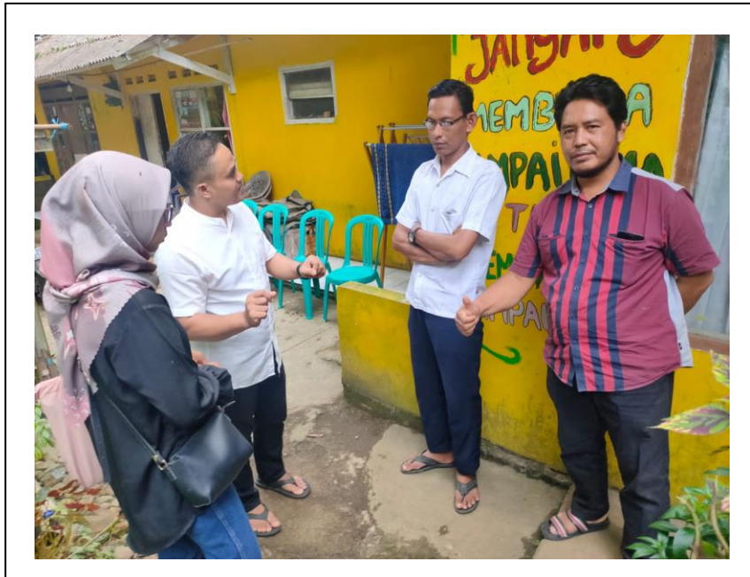
Wawancara dengan Ketua Sudut Baca Kelurahan Cipaku