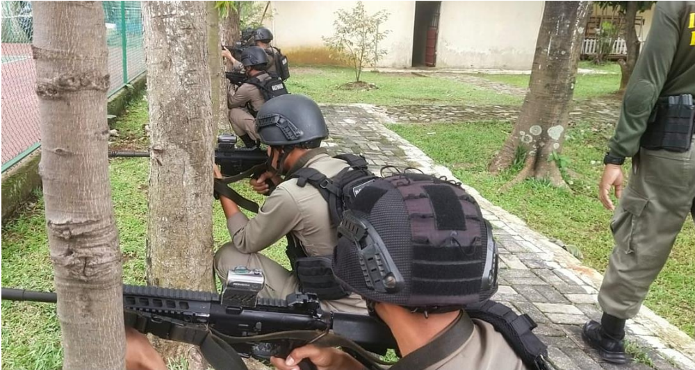
PELATIHAN TATA CARA PENANGANAN TUGAS MENYANGKUT HAM