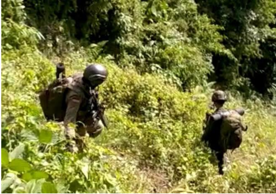
OPERASI TERHADAP TERORIS DI POSO