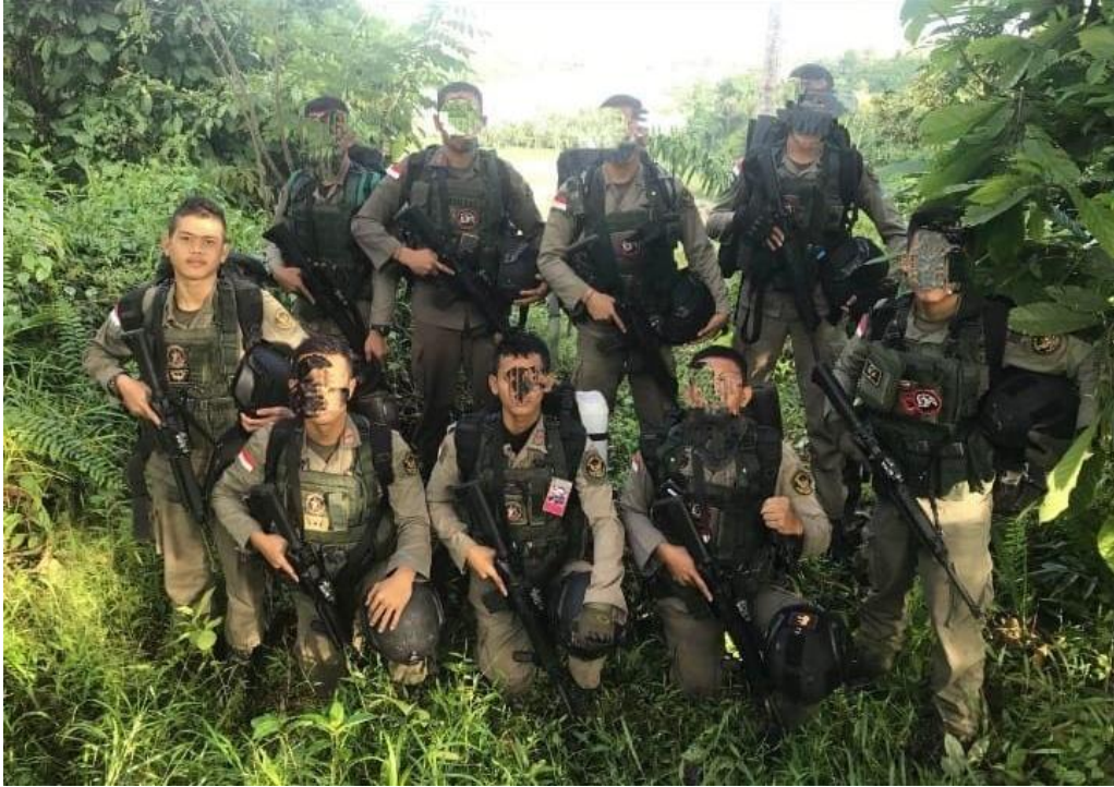
PENUGASAN DI POSO