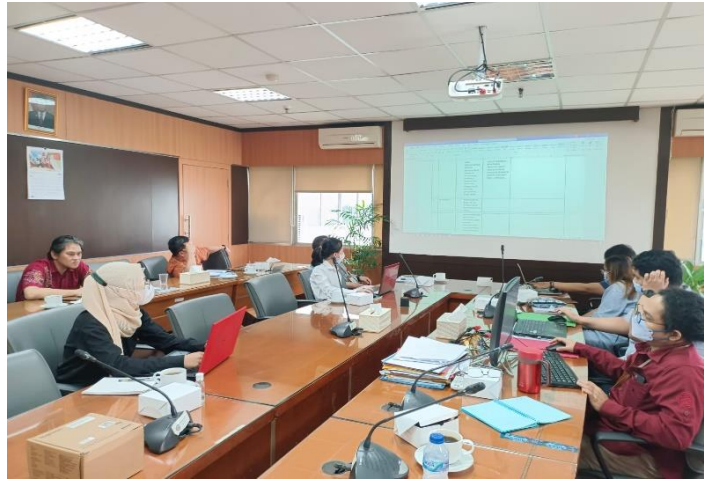
(Rapat Pembahasan Perencanaan Pembuatan Permentan dan Peraturan Turunannya)