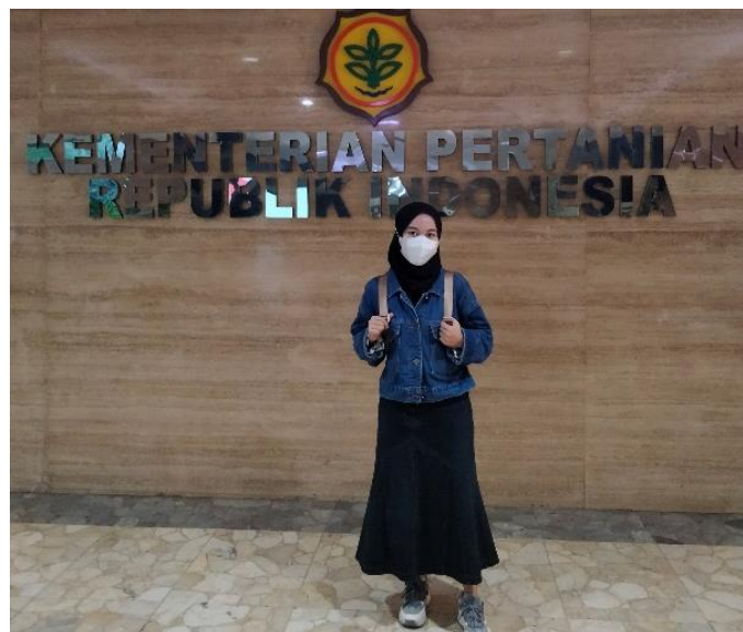
(Dokumentasi Magang Hari Terakhir Bersama Staf Biro Hukum Kementerian Pertanian Republik Indonesia)