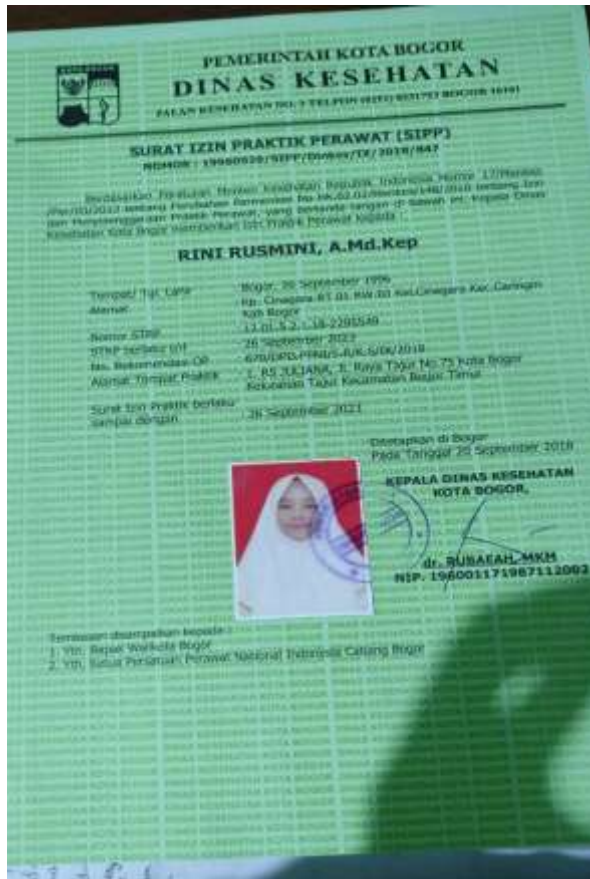
Gambar 1.8 (Surat Izin Praktik Perawat (SIPP))