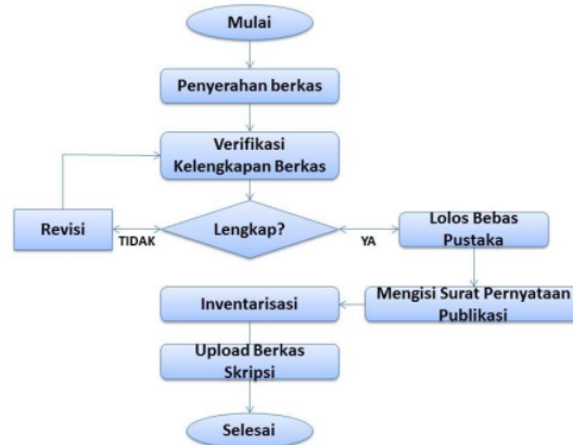
Gambar 2. Bagan tahapan publikasi karya ilmiah skripsi mahasiswa di Perpustakaan Universitas Djuanda.

Dari hal tersebut terbentuklah skema dari tahapan publikasi karya ilmiah skripsi mahasiswa di Perpustakaan Universitas Djuanda Bogor.